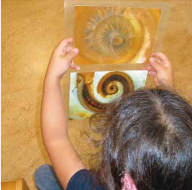
Makroaufnahmen der Gehörschnecke.