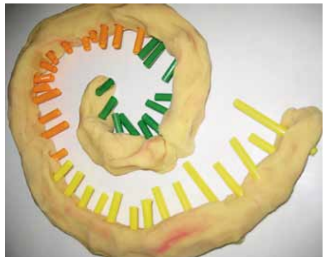
Knetmodell der Schnecke.